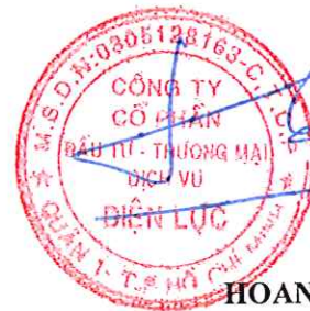
HOANG HUY HUNG